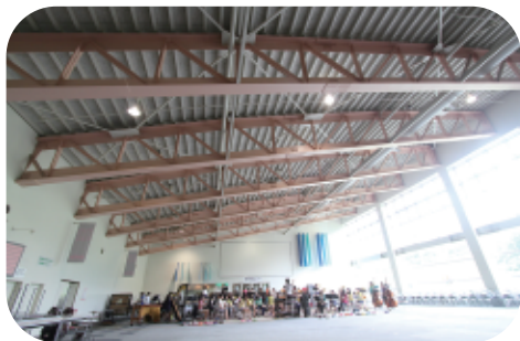
2Fフードコート (約22m × 68m)

吹奏楽の場合は、広大な施設により、パート毎の練習が可能 なうえ、近隣施設がない為、夜まで十分に練習ができます。 施設内に宿泊場所や温泉施設も併設しているので車やバスで移 動する必要もございません。