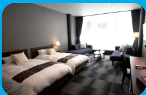
ホテルタイプ (4部屋最大18名)