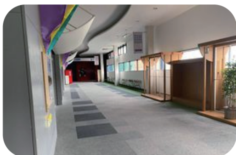
アプローチ通路 (約5m × 25m)