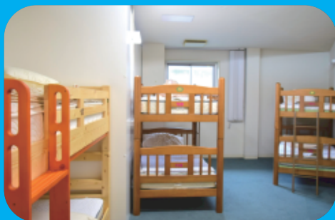
ドミトリールーム (5部屋24名)