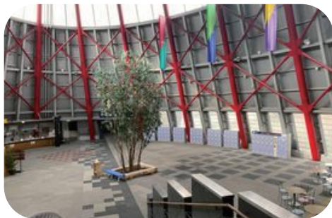
センタードーム (約20m × 40m)