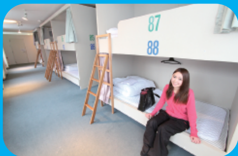
スキーヤーズベット (88ベット)