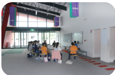
アプローチホール (約8m × 15m)